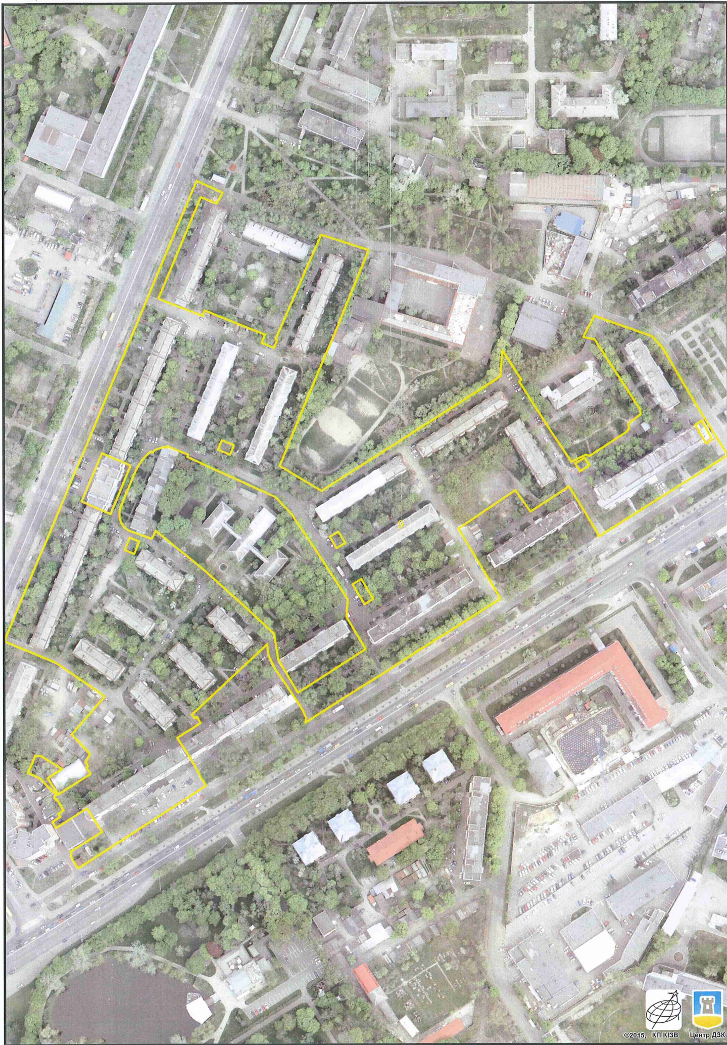
Растри аерофотозйомки 2014р.