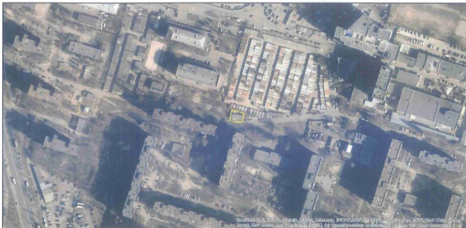
Матеріали аерофотозйомки 2019 р. виготовлено за даними АІС ОУЗР